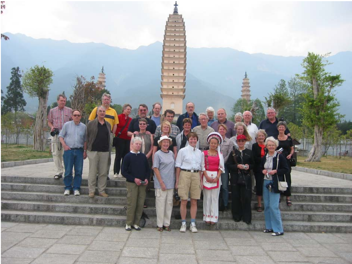
Rejsedeltagerne samlet foran De Tre Pagoder i Dali.

Endelig lykkedes det at få gennemført rejsen til Yunnang Provinsen med fortsættelse ind i Nordvietnam. Først måtte turen aflyses pga. SARS-epidemien, næste gang var der for få tilmeldinger, men 3. gang var lykkens gang og vi drog af sted med 30 personer. Halvdelen var læger og de øvrige var lægesekretærer, sygeplejersker eller andre former for medicinalpersoner. Halvdelen var fra Sverige og halvdelen fra Danmark og så var der en enkelt nordmand.