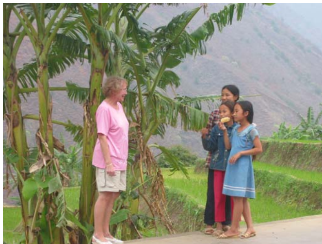
Møde mellem generationer og kulturer under bananplanten